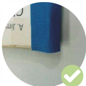
Lloms reforçats amb cinta